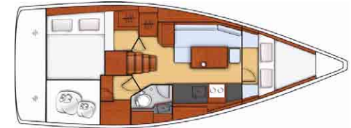
Cruiser - 3 camarotes