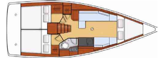
Cruiser - 2 camarotes