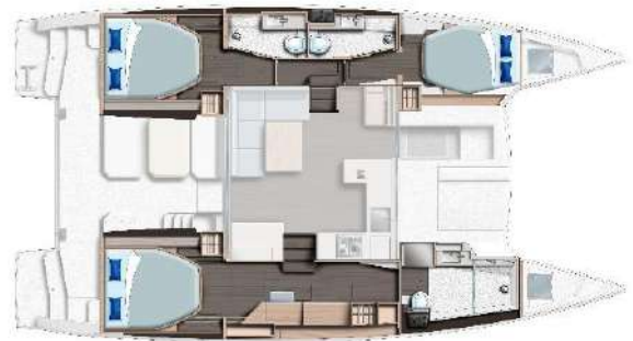
Versión 3 camarote / 3 aseos