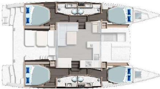
Versión 4 camarotes / 4 aseos